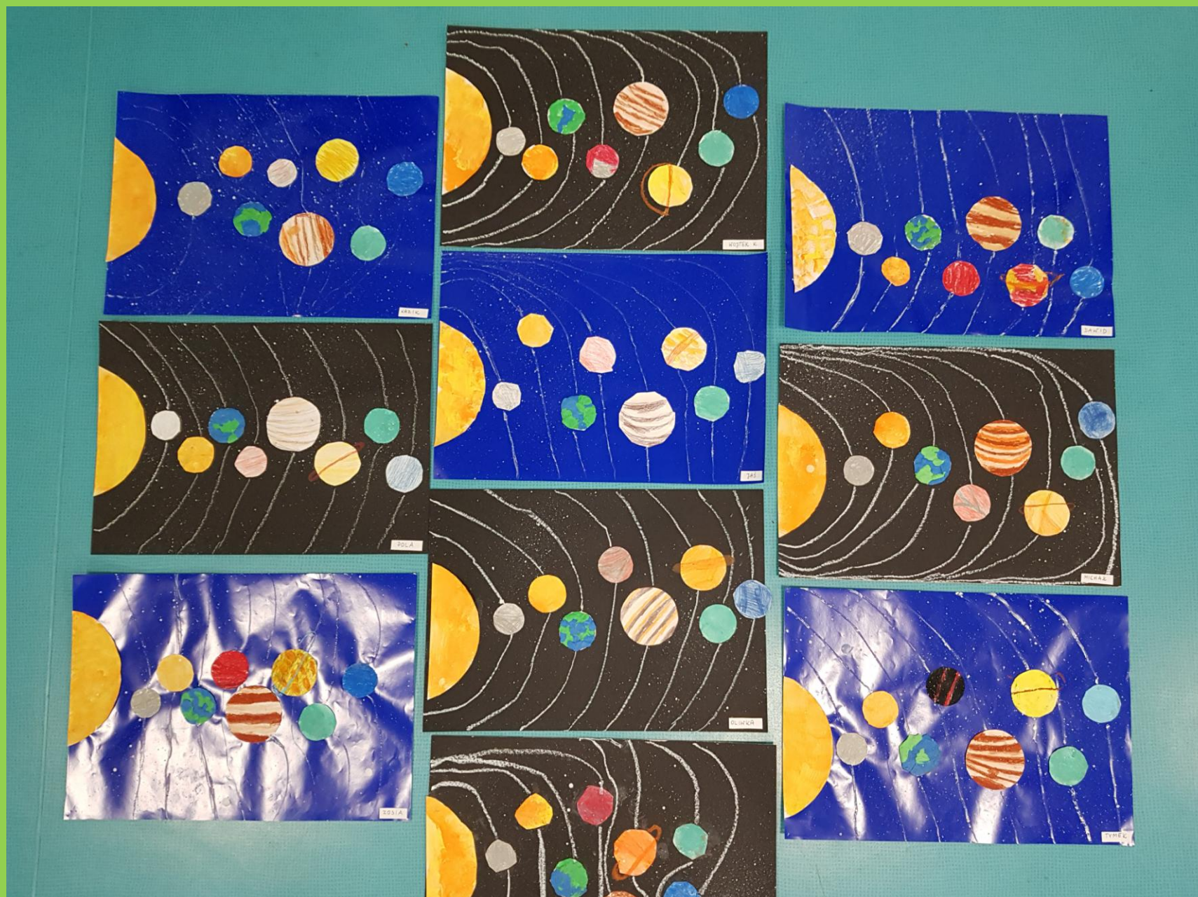
„Układ Słoneczny” - prace plastyczne „Biedronek”