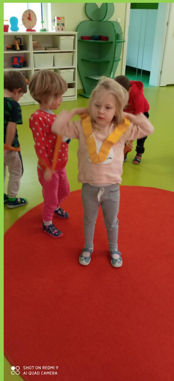
„Jeżyki” bardzo lubią zabawy ruchowe z szarfami.