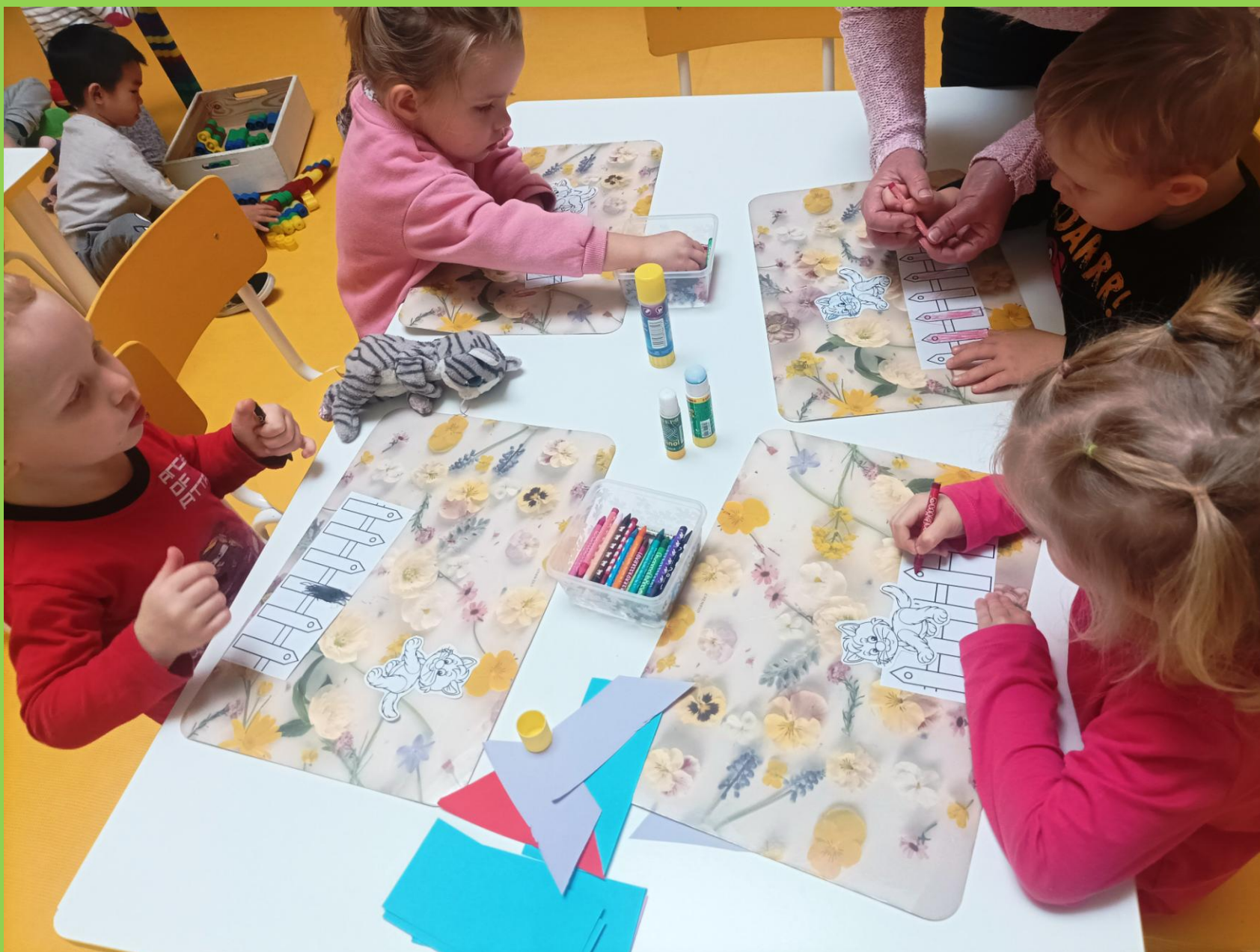
„Misie” podczas wykonania pracy plastycznej uczą się prawidłowego trzymania kredki.