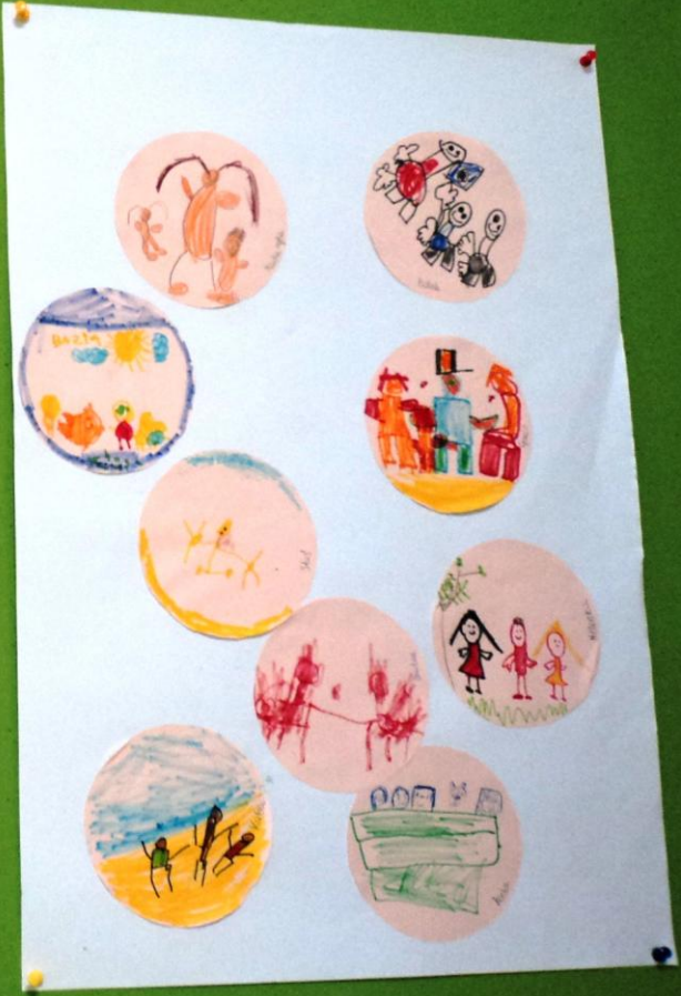
Dzień z Rodziną –rysunki dzieci z grupy III „Jeżyki”