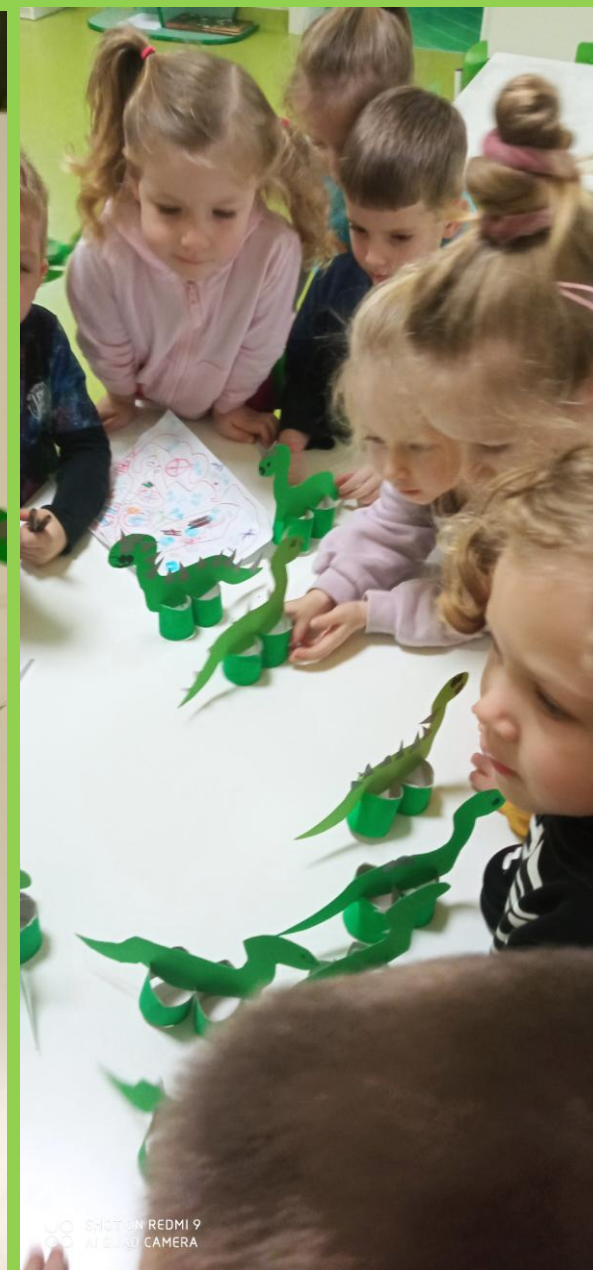
Przedszkolaki wykonały pracę plastyczną, której bohaterami były oczywiście dinozaury.