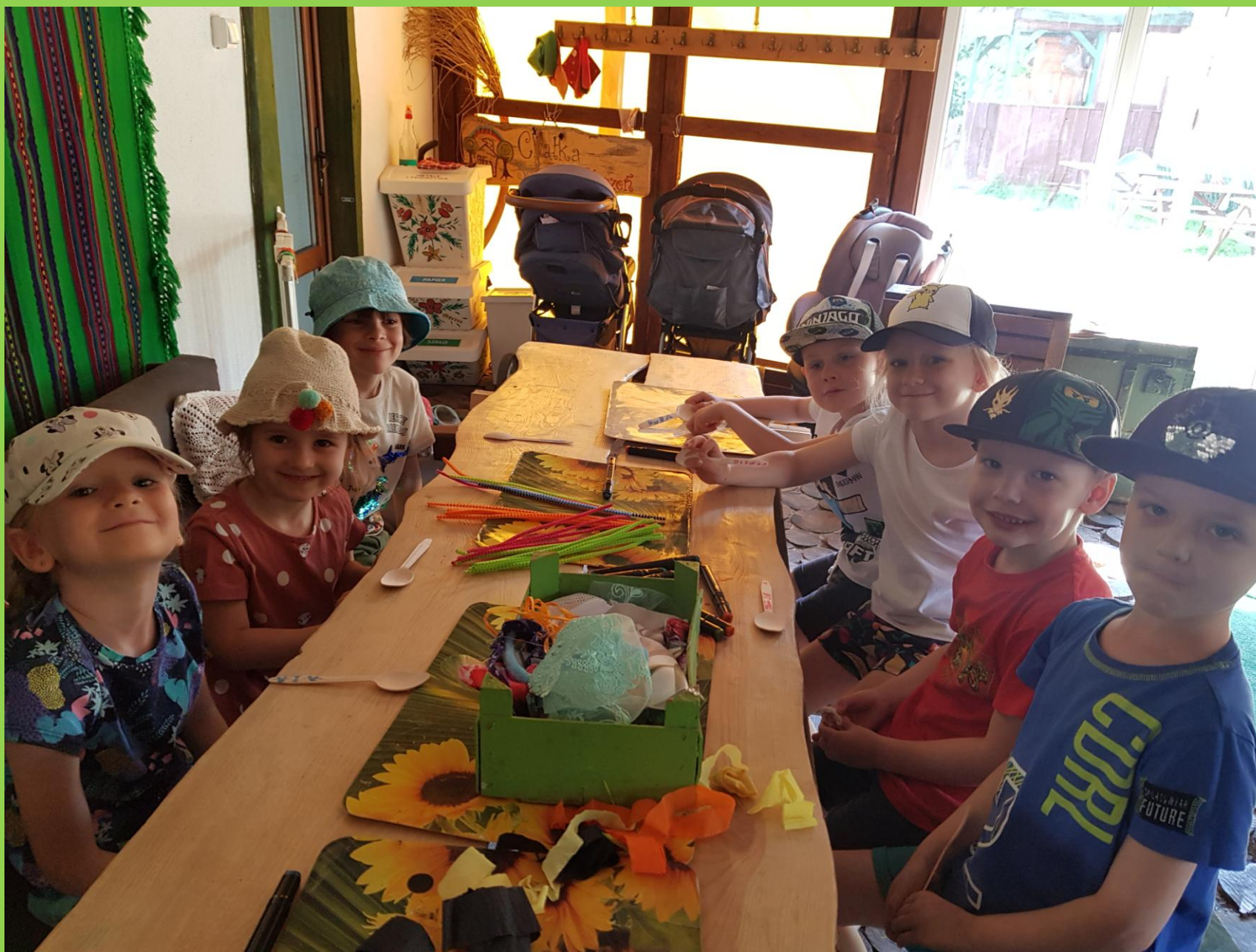
„Biedronki” w czasie zajęć plastycznych