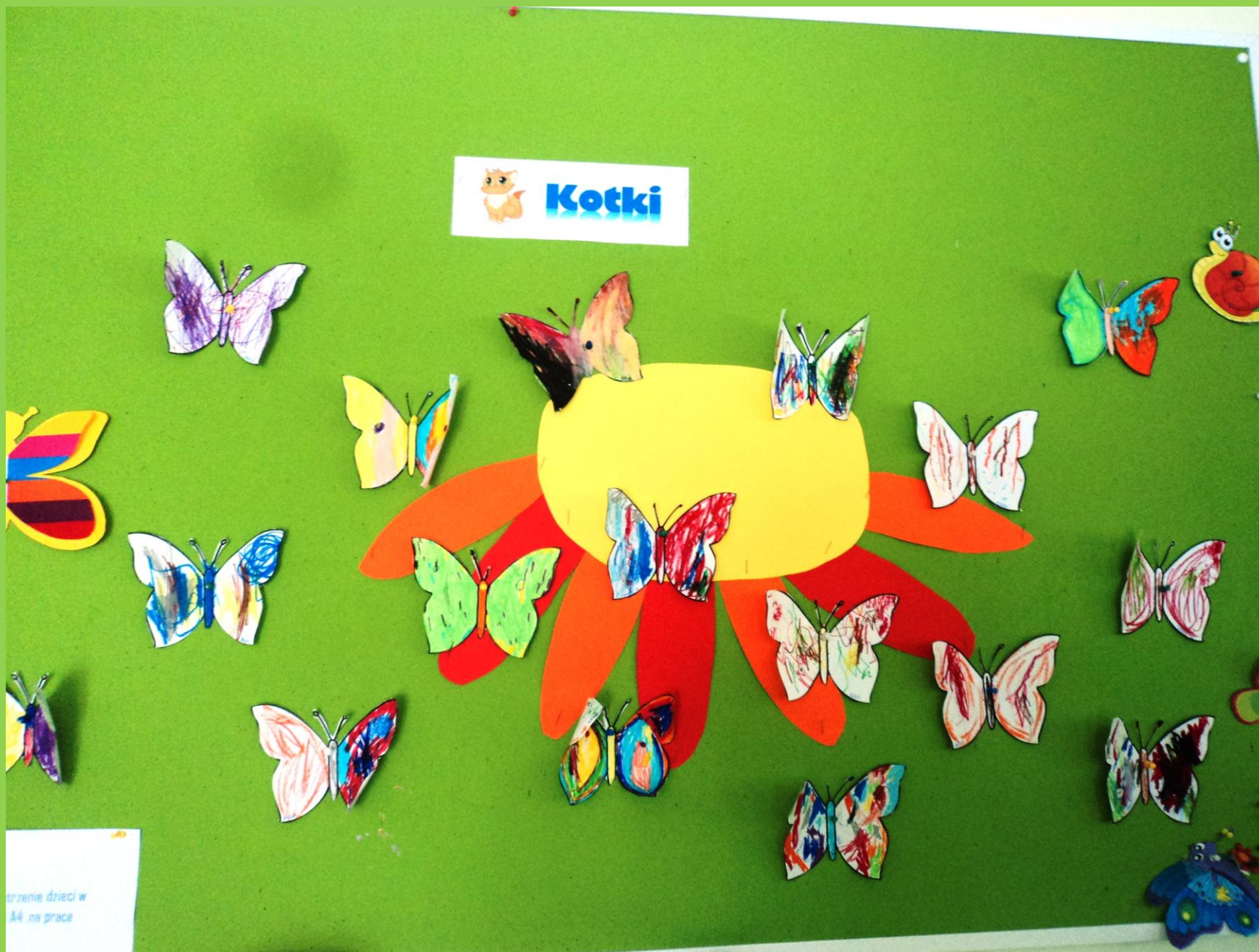
Dzieci z grupy I „Kotki” wykonali wspaniałe prace plastyczne.