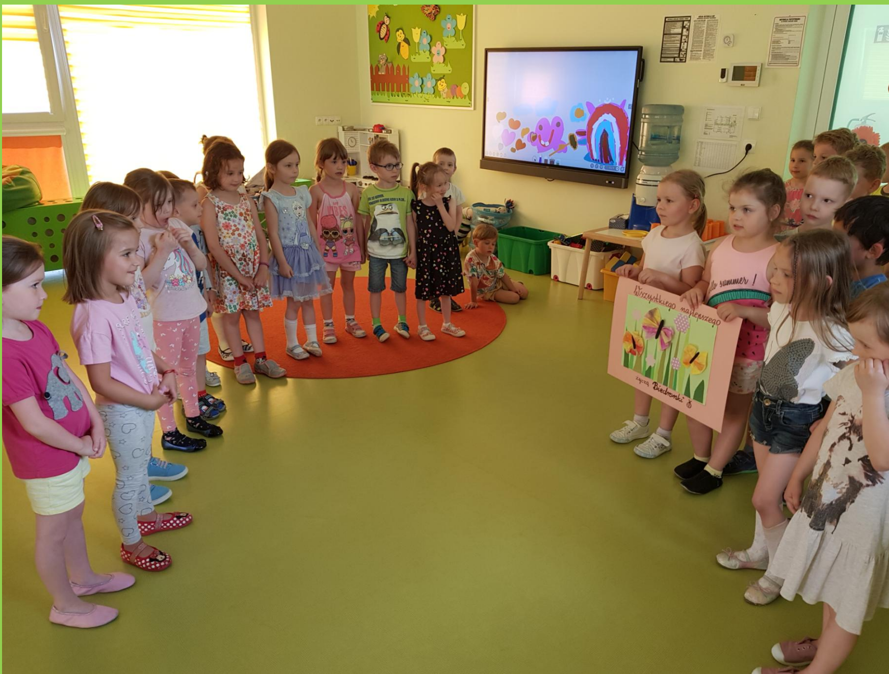
Dzieci z grupy V „Biedronki” wręczają prezent „Motylkom” w dniu ich Świąt.