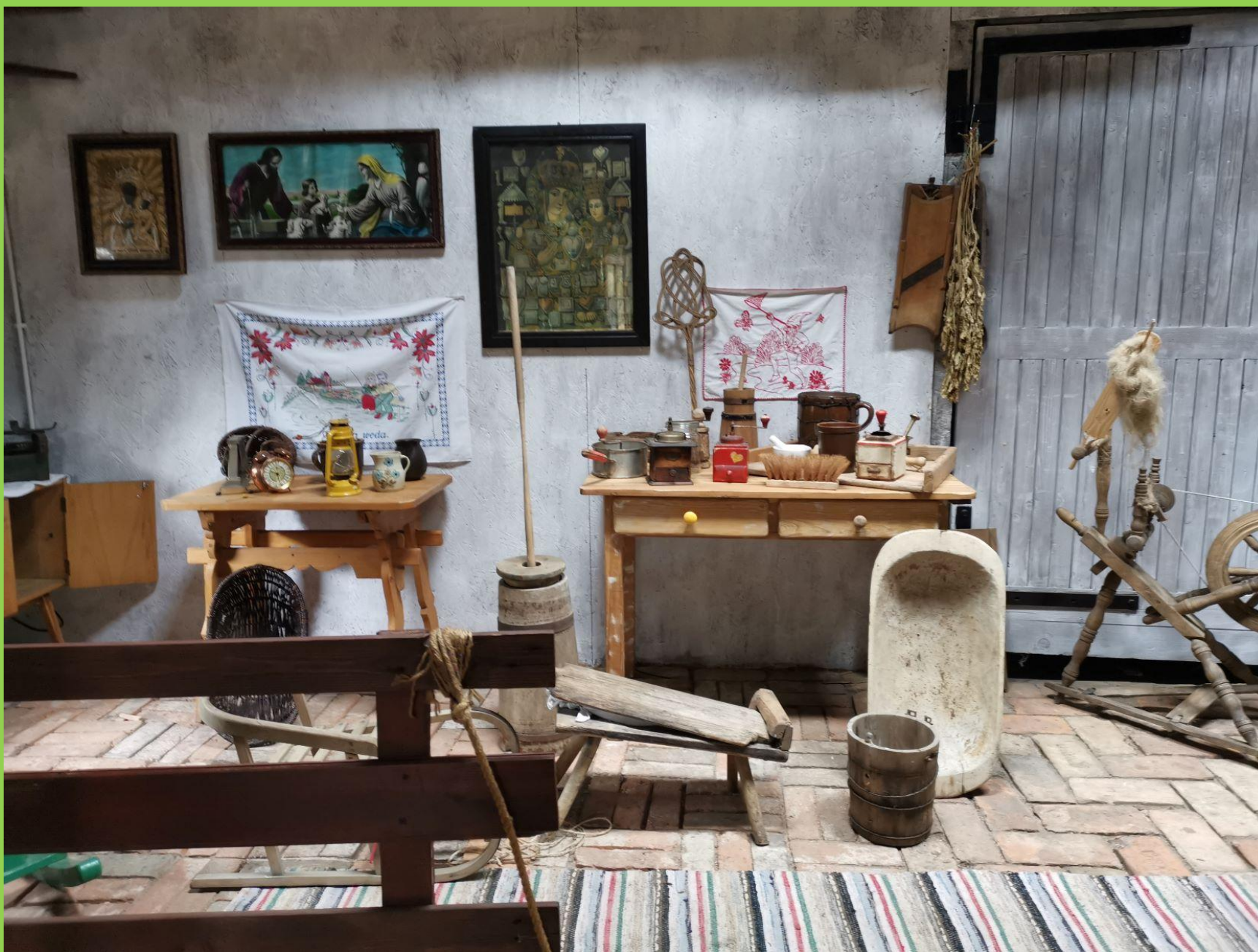
Dzieci mogły zobaczyć wyposażenie domu z dawnych lat...