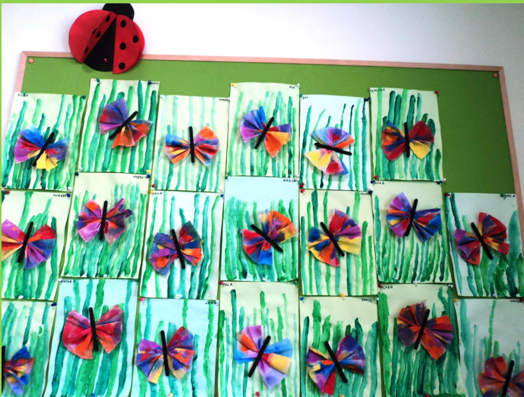
„Biedronki” wykorzystując różnorodne materiały wykonały prace plastyczne pt. „Motyle”