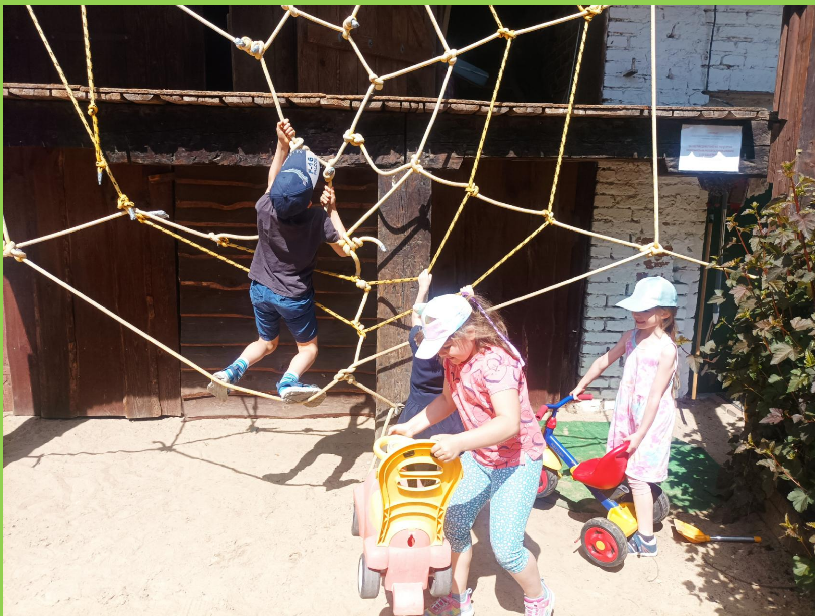
Czas na zabawy ruchowe...