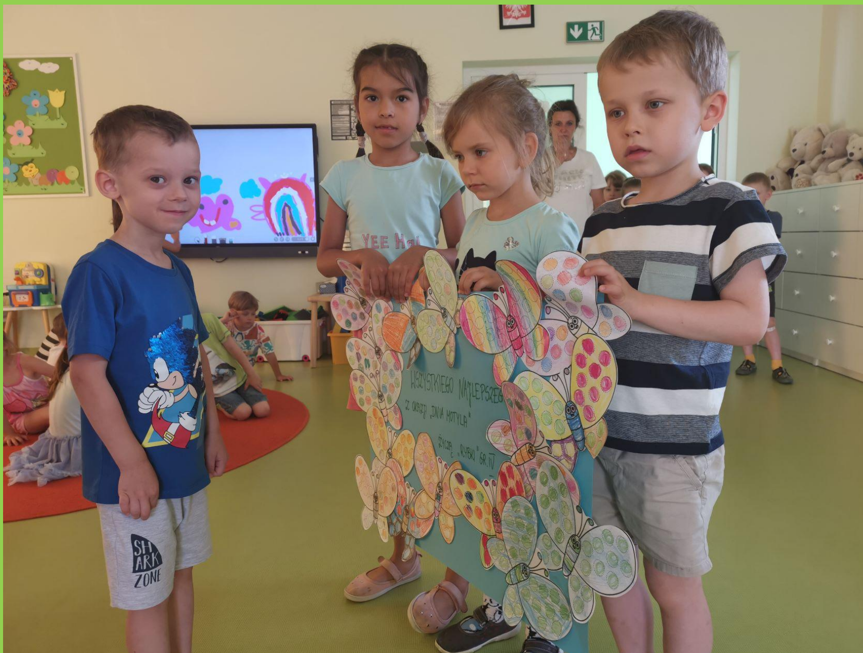
„Rybki” wręczają prezent –pracę grupową dzieciom z grupy III „Motylki”