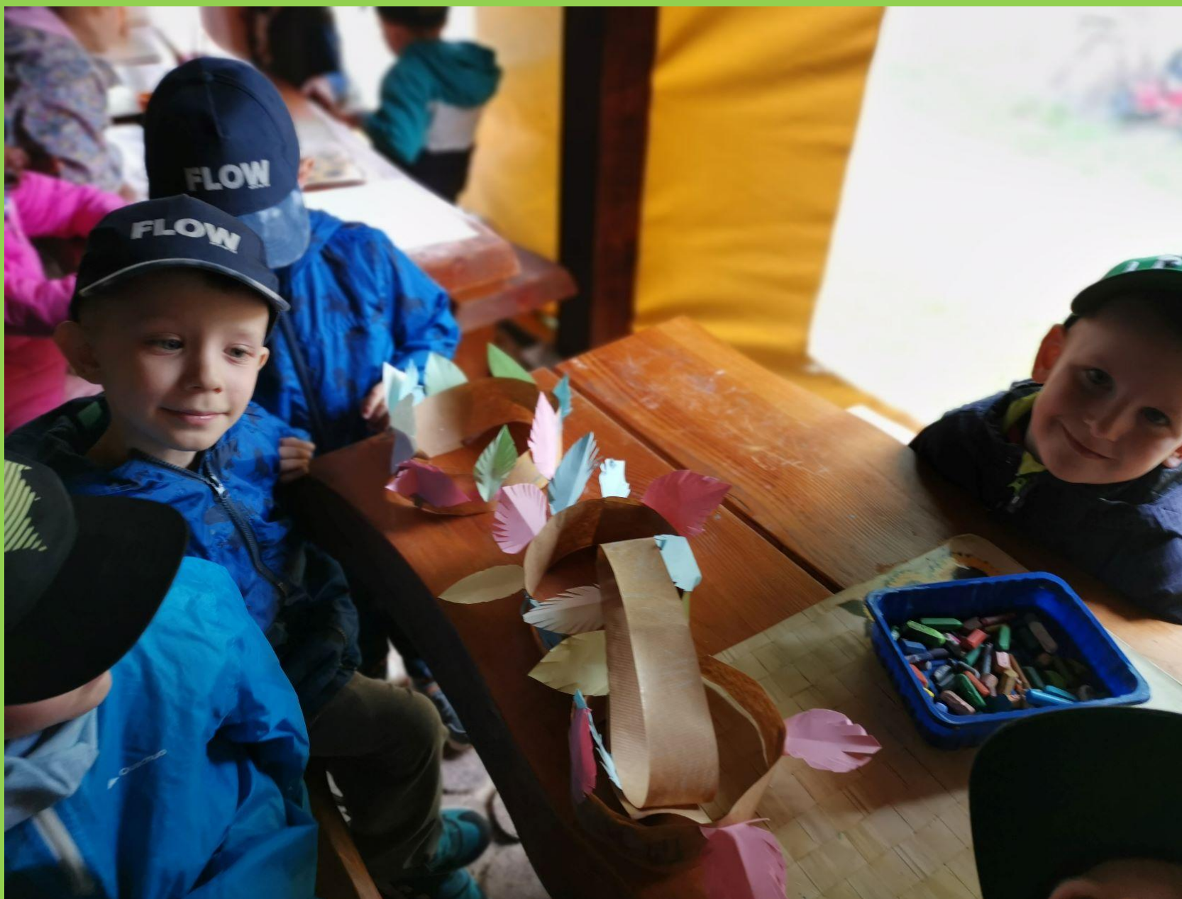
Dzieci były dumne ze swoich pióropuszy