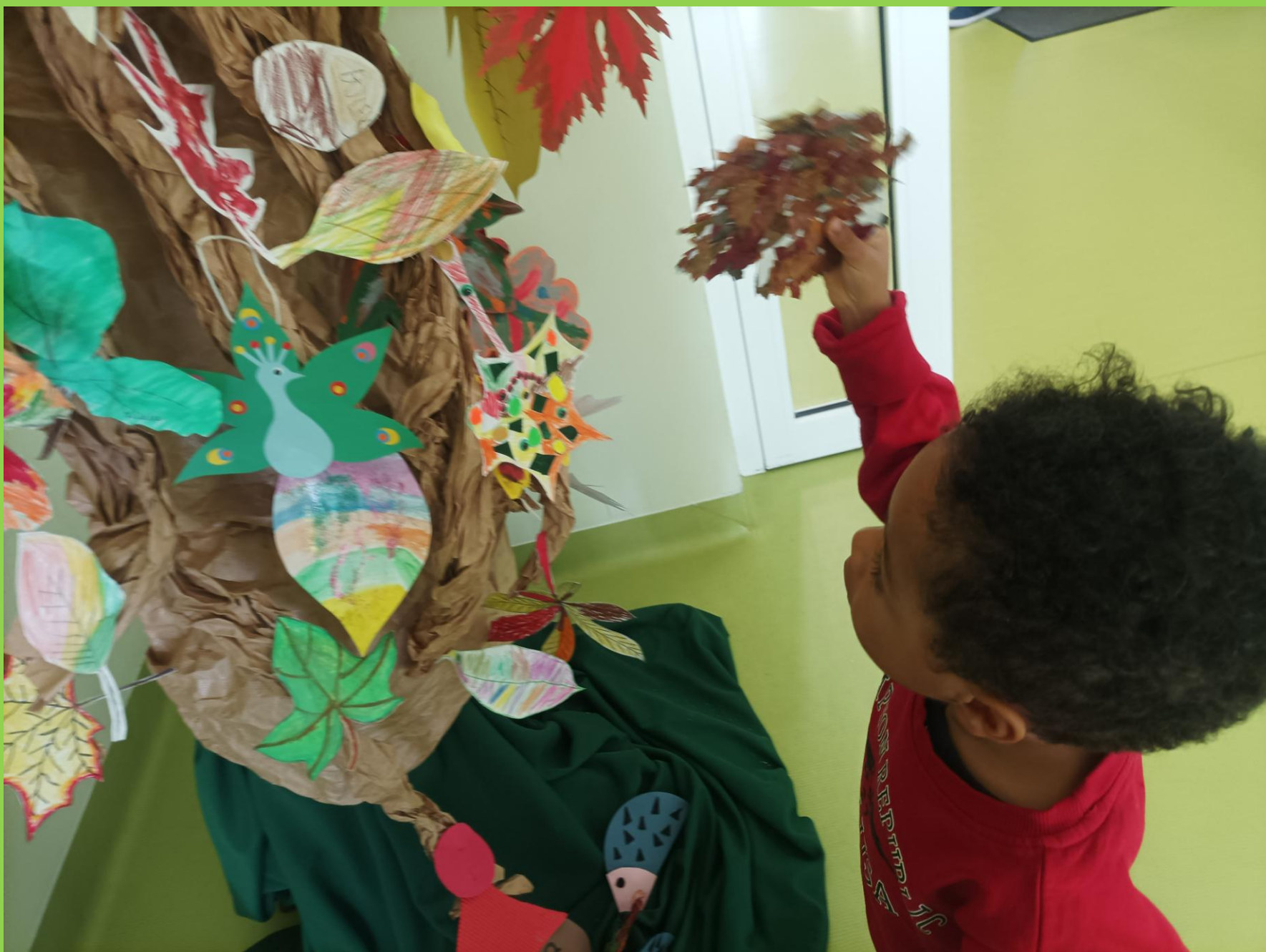
Przedszkolaki z dumą prezentują swoje kolorowe liście i zawieszają je na drzewku w szatni.