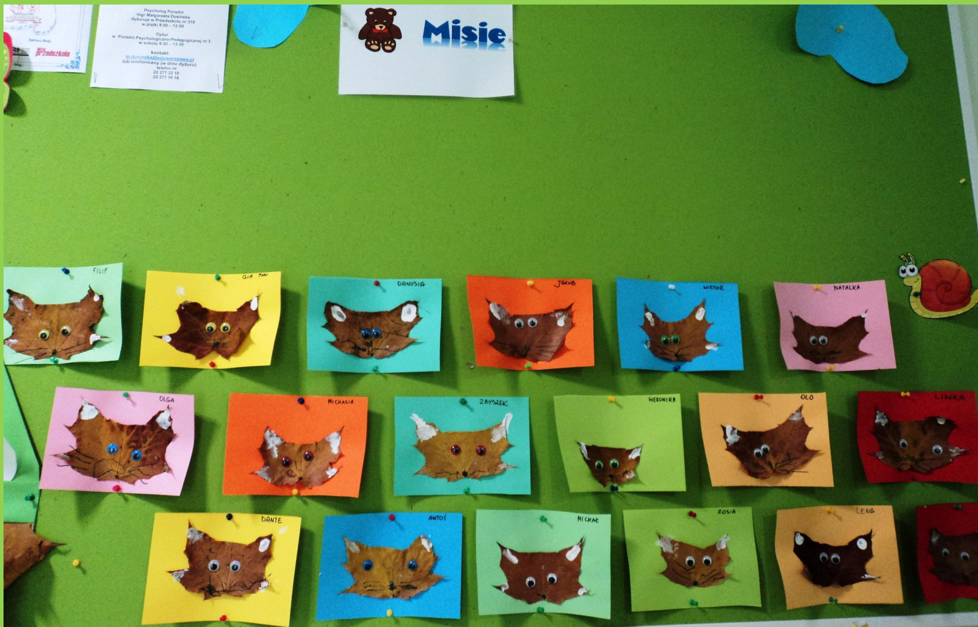
Prace plastyczne „Misiów”- kotki to prawdziwe „słodziaki”!