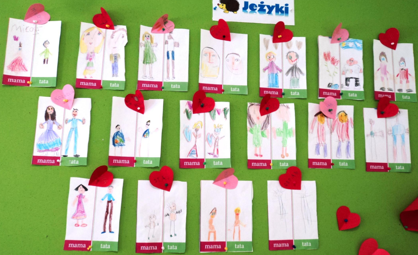
„Portrety Rodziców” wykonane przez „Jezyki”