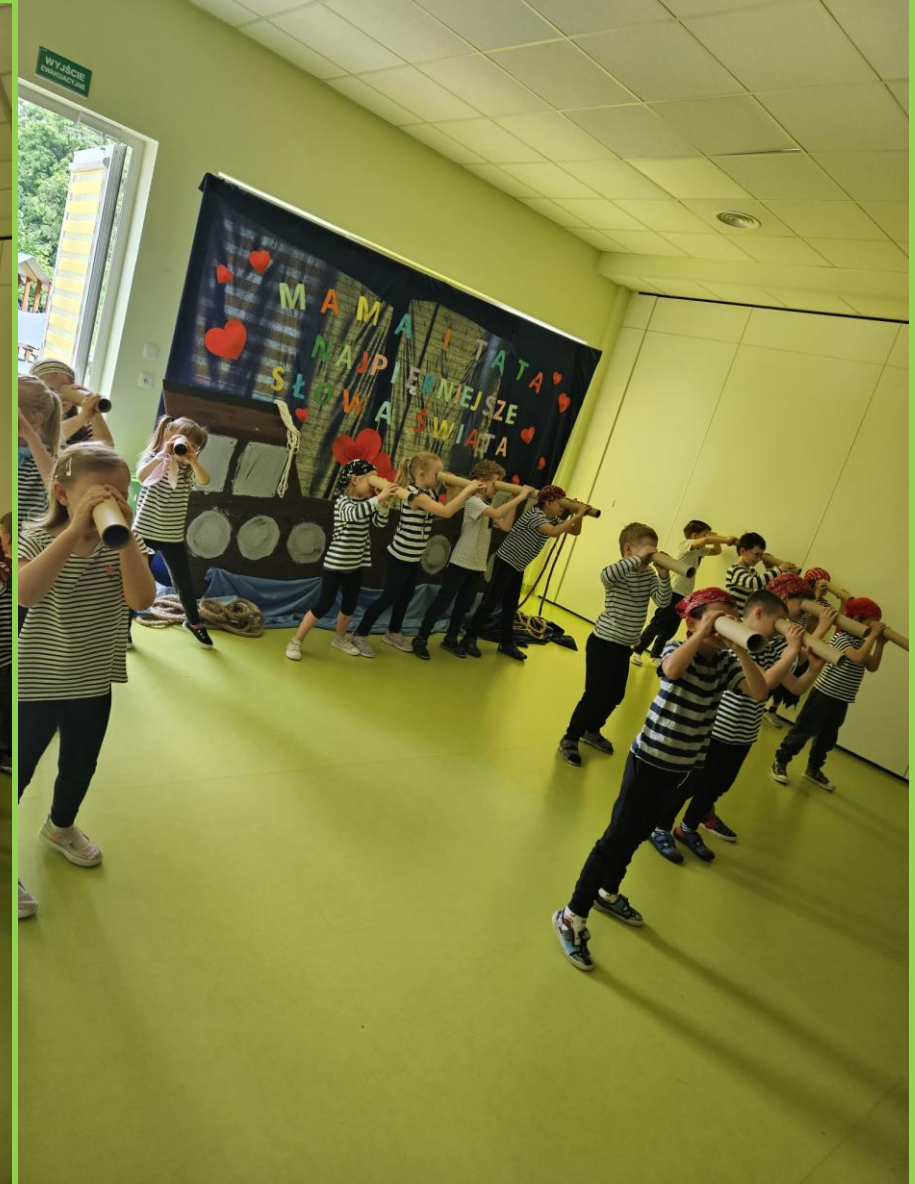
„Morskie opowieści” – grupa VI „Biedronki”