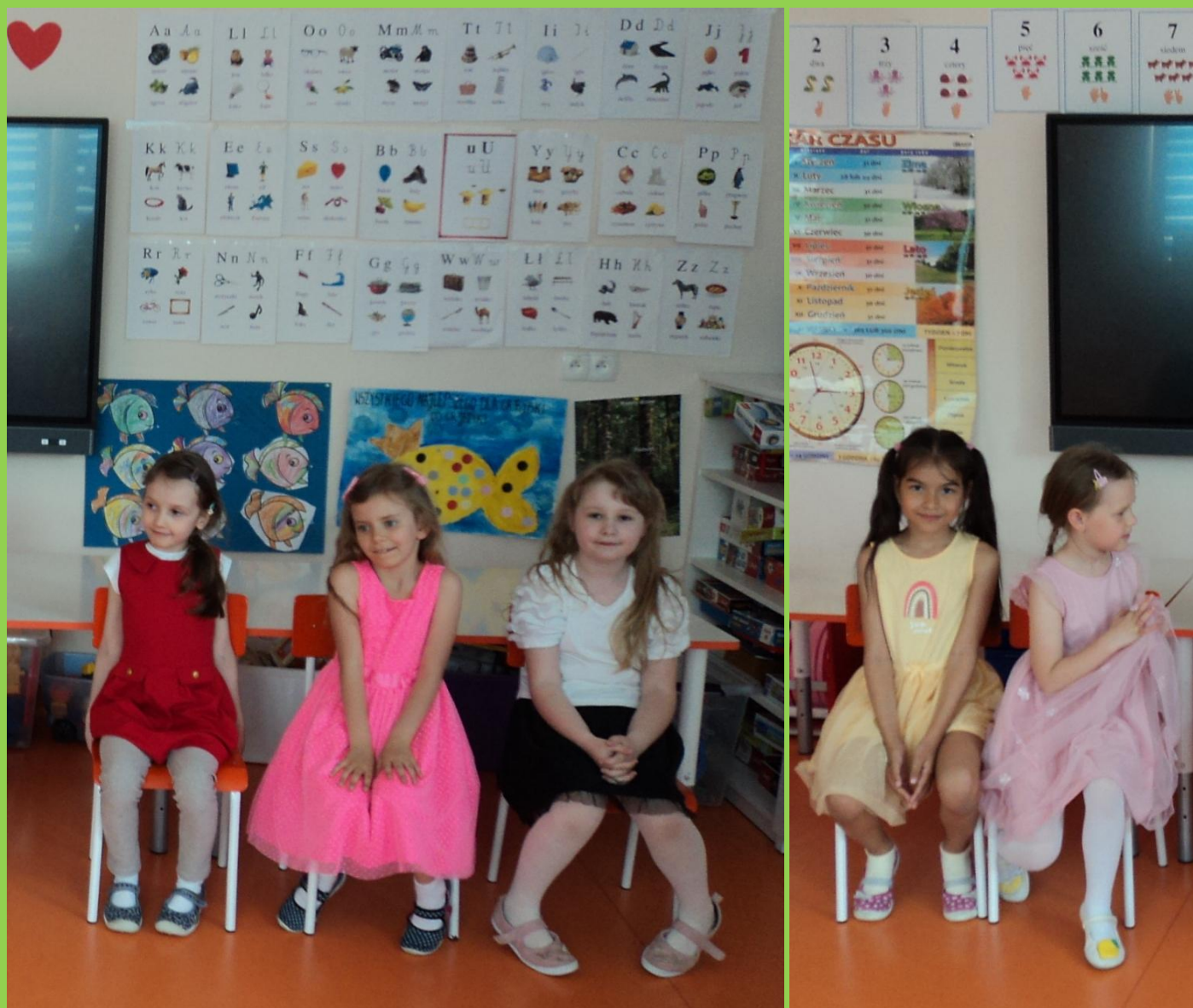
Czas relaksu przed występem