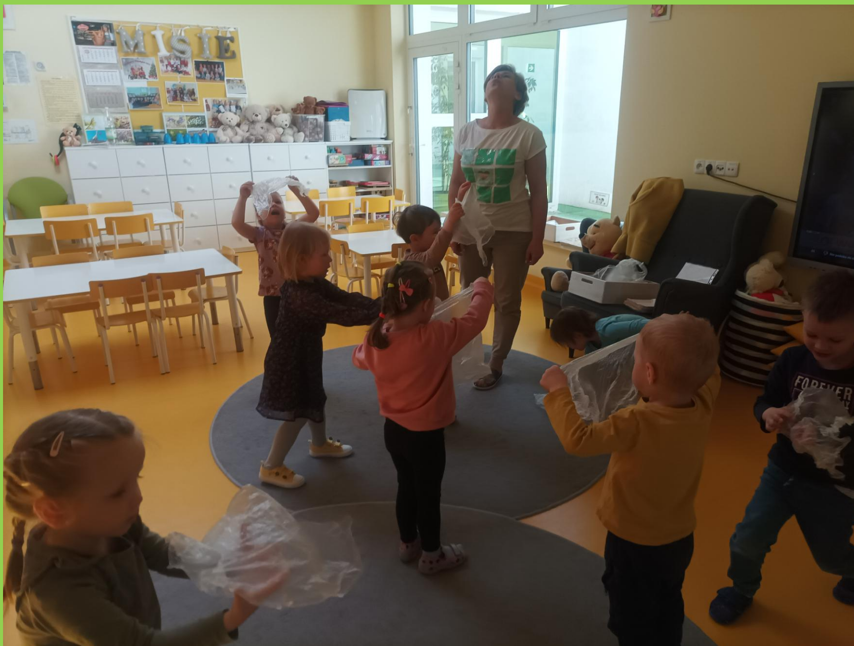
Misie starały się dokładnie wykonywać wszystkie ćwiczenia.