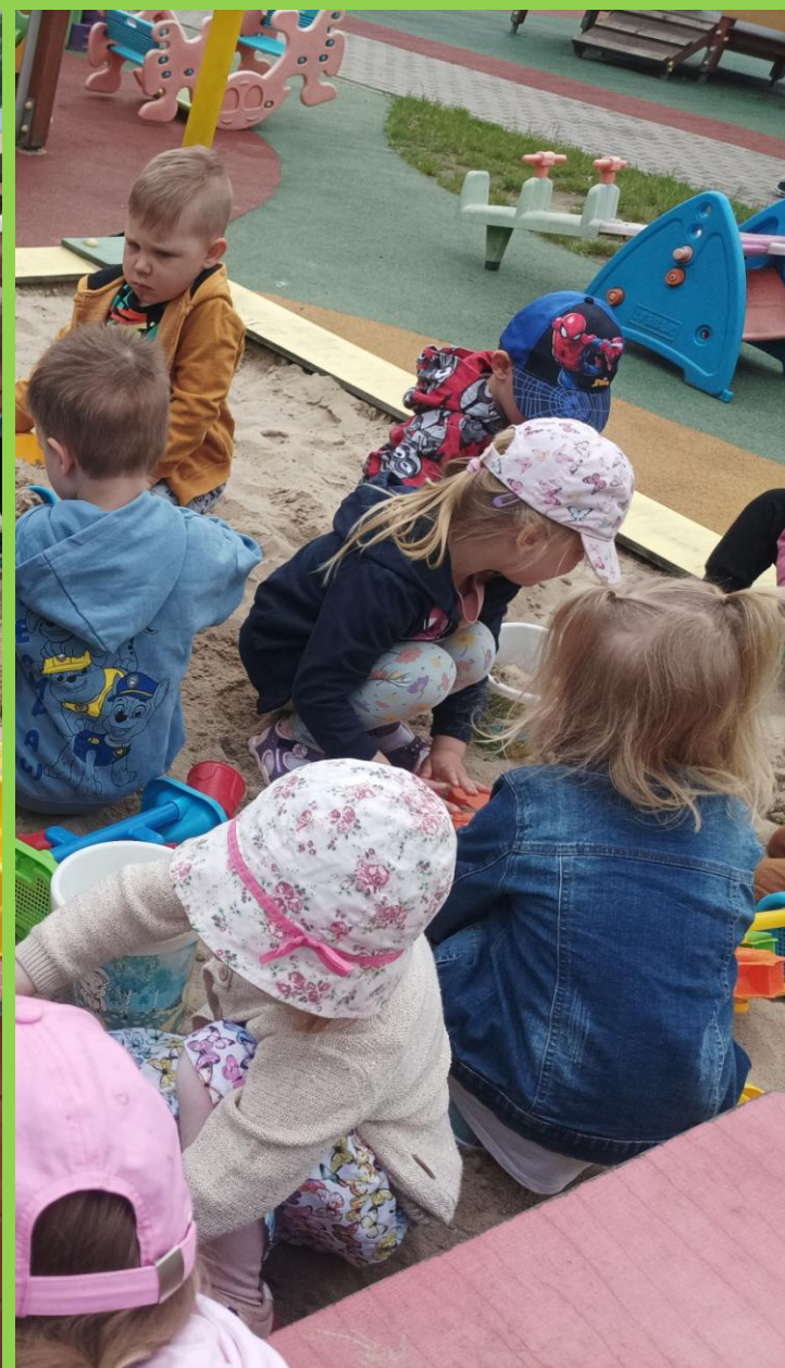
Dla „Misiów” piaskownica to raj!