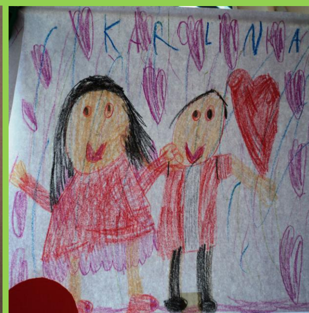
„Rybki” przygotowały też laurki dla swoich rodziców.