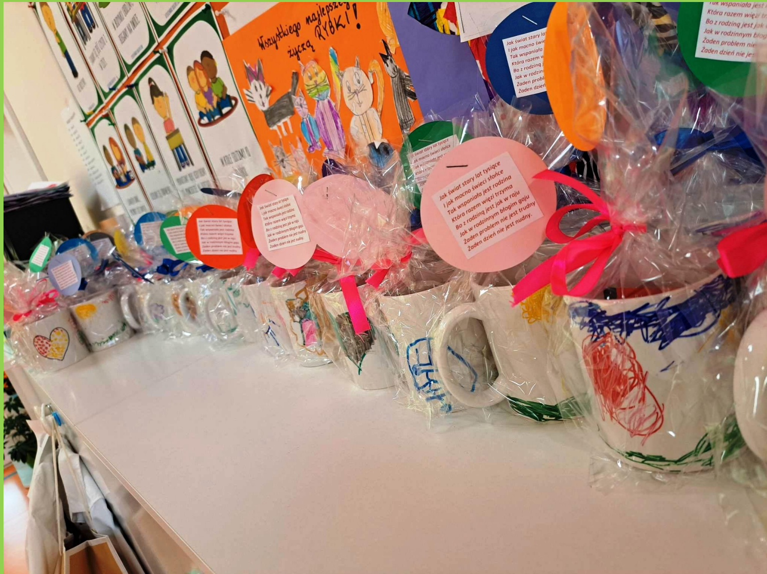
Prezenty wykonane przez dzieci z grupy „Kotki”